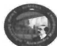
Liceul Tehnologic „Alexandru Macedonski” Melinesti