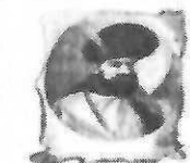
Școala Gimnazială „Mihai Viteazul” Craiova